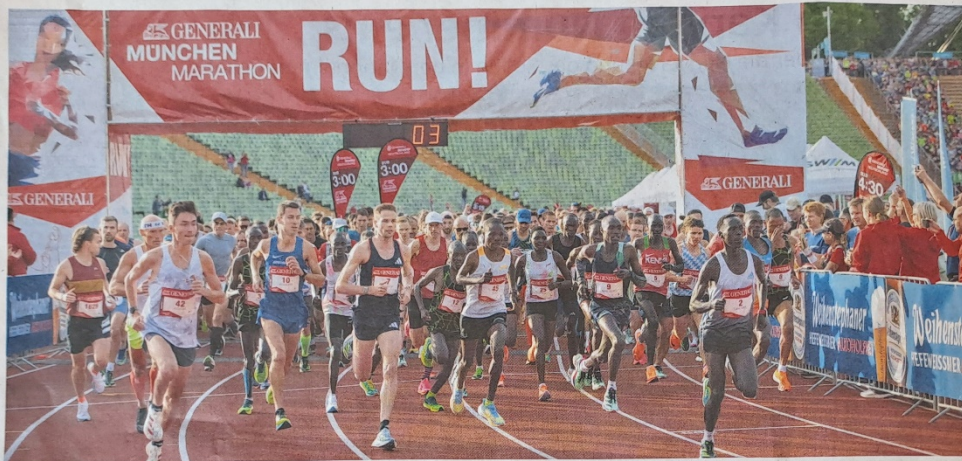
Der München Marathon ist eine Institution, doch ab 2025 droht der Traditionsveranstaltung eine Neuausrichtung.