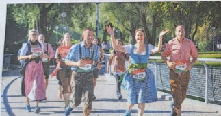
Münchner Spezifikum: Der Trachtenlauf. Die neuen Veranstalter wollen ihn auch anbieten.