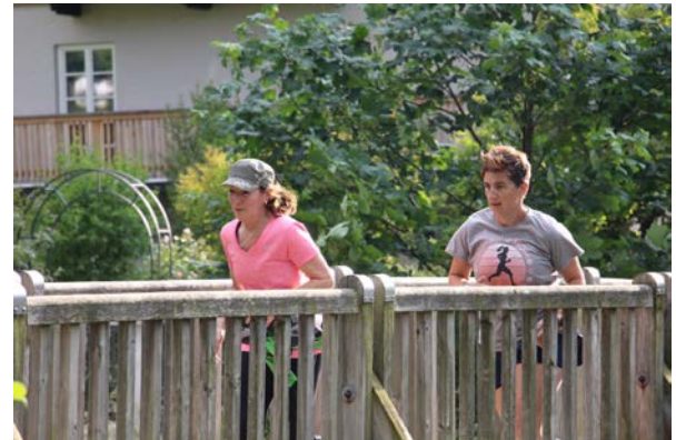
Los geht's wahlweise über 3, 5 oder 7 km