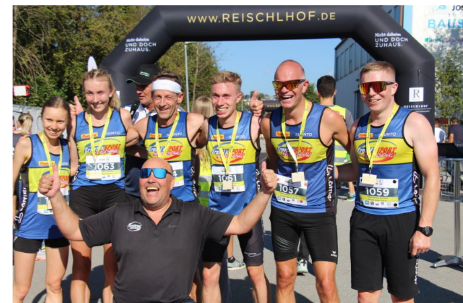
Kennst mi? Das „Team Ernstl's Sport“ machte wirklich ernst und ging in allen Bewerben mit auffallenden Leistungen ins Ziel. Im Hauptlauf der Frauen über 13,6 km holte des Team aus Neureichenau gleich die ersten drei Plätze.