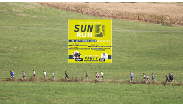
Kennst mi? Nach dem Start hinaus in die Landschaft rund um Wegscheid