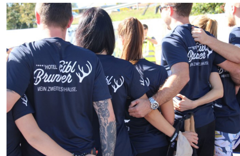
Kennst mi? Das Hotel Eibl-Brunner in Frauenau präsentiert beispielgebend den Zusammenhalt im Team. Hüttenhof in Grainet, Jagdhof Wellnesshotel in Röhrnbach und das Bier- und Wohlfühlhotel Gut Riedelsbach waren ebenfalls dabei.