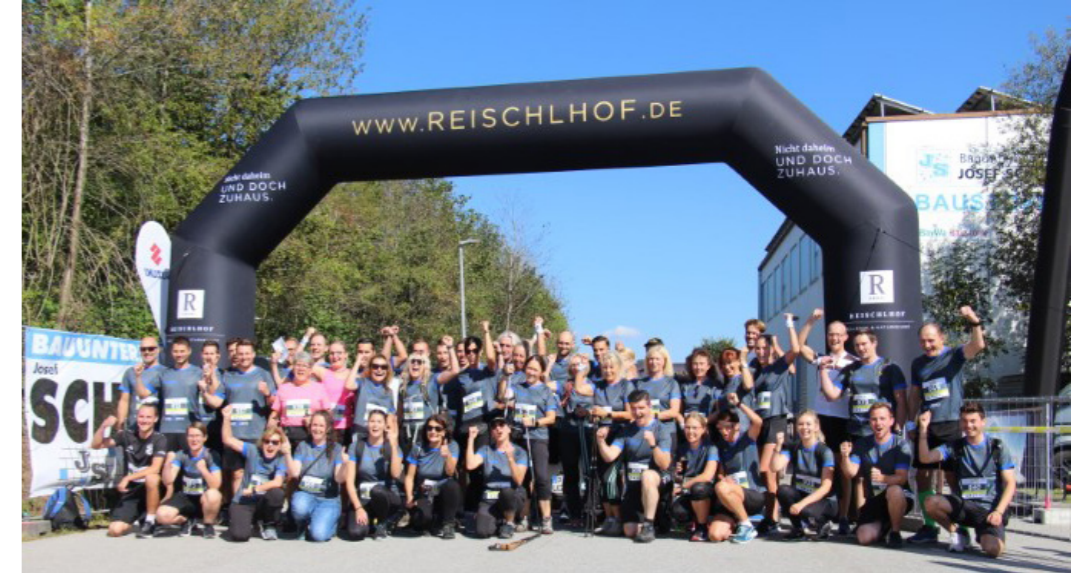
Kennst mi? Stark vertreten und gut drauf: UMIDA Components & Modules GmbH, Elektronikhersteller aus Obernzell