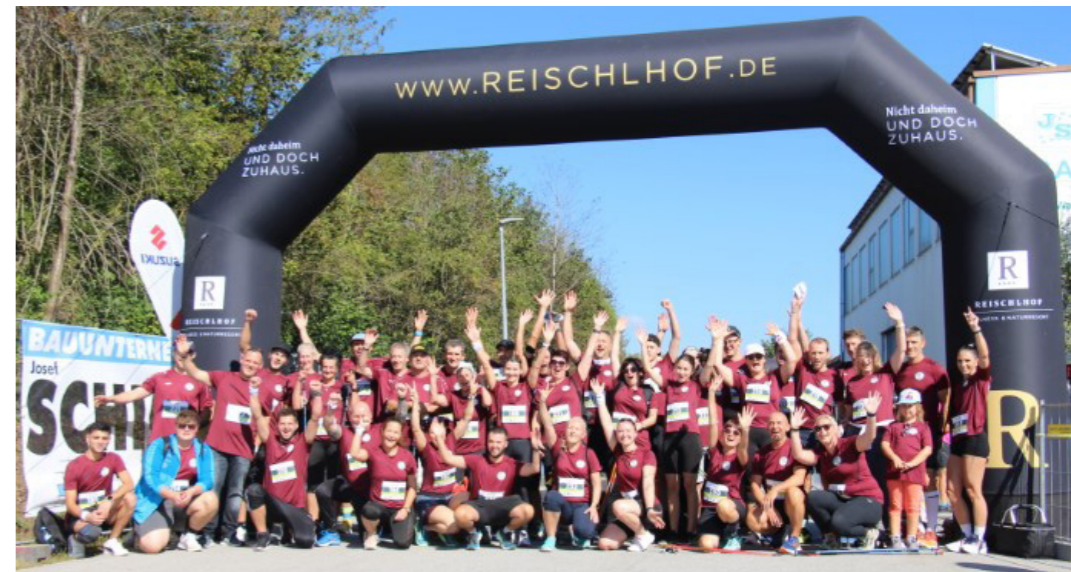
Kennst mi? Jubel schon vor dem Start: Die Draxinger GmbH Maschinen und Werkzeuge, in Hauzenberg, Bavaria