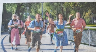
Münchner Spezifikum: Der Trachtenlauf. Die neuen Veranstalter wollen ihn auch anbieten.