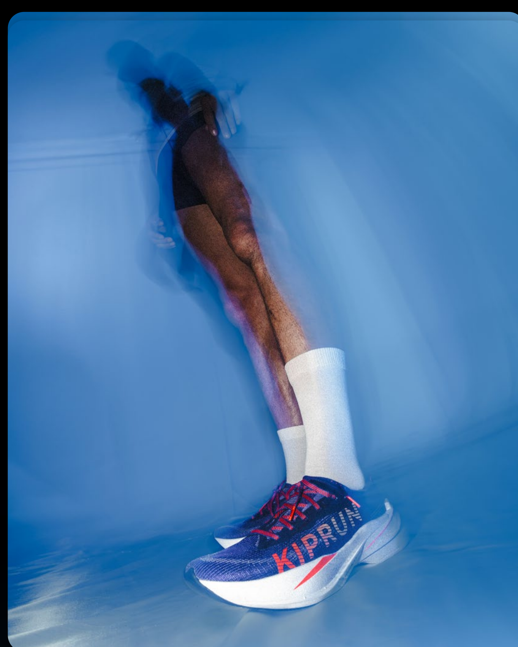
Jimmy Gressier wearing the new KD900X LD+

With KIPRUN's support, the runner aims to shine at the Los Angeles Olympics Games . Jimmy Gressier is also taking on new challenges from the 2025 season. He is aiming for exceptional performances in the John Terrier Classic 5000m on February 1, 2025 in Boston as well as the 2 miles of the 117th Millrose Games on February 8, 2025 in New York before the main event of the early year, the European Road Running Championships in Leuven on April 13, 2025.