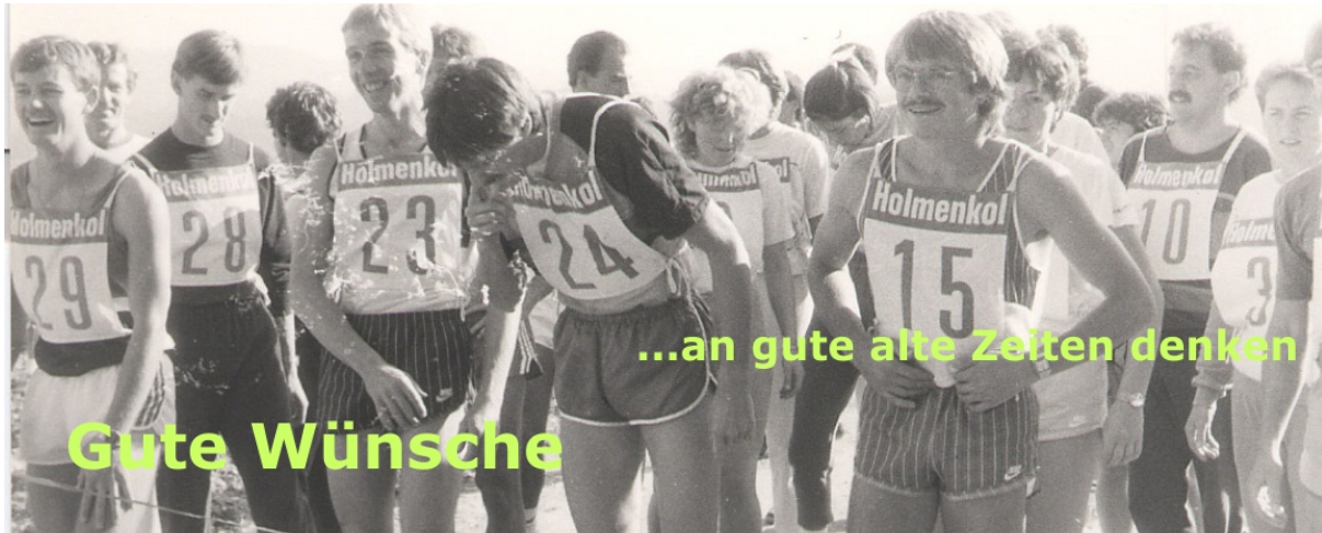
Start zum 1. Stampfl Berglauf im Jahr 1985