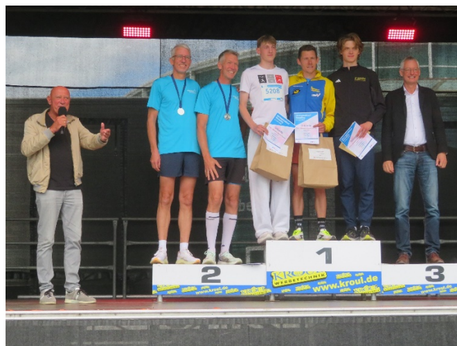
und die Sieger über die 10 km

Die Siegerehrungen auf der großen Bühne begannen um 12 Uhr und zogen sich lange hin, obwohl nur die jeweils drei besten Einzelläufer*innen der 4 Bewerbe und die allerbesten 6 Teams (Damen, Mixed, Herren) geehrt und mit Preisen der Sponsoren bedacht wurden. Der Moderator machte mit einigen Geehrten kurze Interviews auf der Bühne und entlockte fast allen auf Nachfrage die Absicht oder gar Zusage, im kommenden Jahr hier zur 16. Auflage wieder an den Start zu gehen.