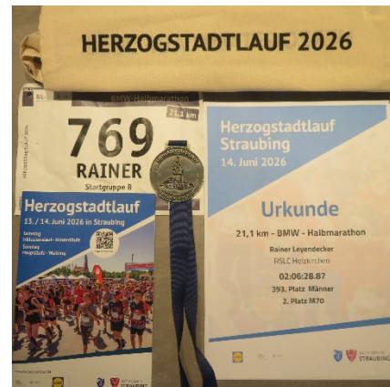
Erinnerungsstücke vom Lauf

Bereits am Samstag, 13. Juni reiste ich an, um die berühmte Stadt in Ruhe zu besichtigen und mein Start-Sackerl in einer Ausstellungshalle der Messe in Empfang zu nehmen. Auf dem riesigen Areal des Gäuboden-Volksfestes vor den Toren der erhöht liegenden Altstadt mit ausreichend Parkplätzen „Am Hagen“ und großzügigem Event-Bereich war Platz für alle Aktiven und viele Stände diverser Art.