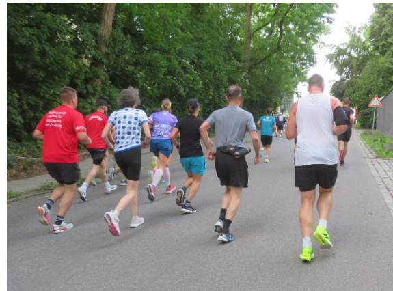
Erste Steigung hinauf in die Altstadt

Nur die ersten rund 1.500 m ab dem Start verliefen wirklich flach, danach zeigte sich der bewährte Parcours durch die Stadt als durchwegs wellige Strecke mit immer wieder kleinen Steigungen und Gefällstrecken, so dass sich das Läuferfeld bald auseinander zog. Etwa ein dutzend Mal stoppte ich am Rand der Strecke, um Fotos der Laufenden ohne Verwackler schießen zu können, so dass mich die Aktiven hinter mir immer wieder überholten. Sehr spannend wegen der vielen Zuschauer und Touristen war das zweimalige Durchlaufen der historischen verkehrsberuhigten Altstadt mit ihren vielen Kirchen und den Prachtbauten entlang der breiten Fußgängerzonen der Theresien- und Ludwigsstraße.