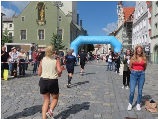
Am Theresienplatz vor km 9

Nach genau 10 km erreichten wir wieder das Start-Ziel-Areal. Ich kam mit 59 Minuten vorbei und hörte den Moderator rufen, dass die Spitzengruppe bereits bei Kilometer 17 wäre. Nun folgte unsere zweite Runde, die nach etwa 1.500 m mit einer flachen Wendepunktstrecke am Moosgraben-Bach entlang auf genau 11,095 km ausgedehnt wurde.