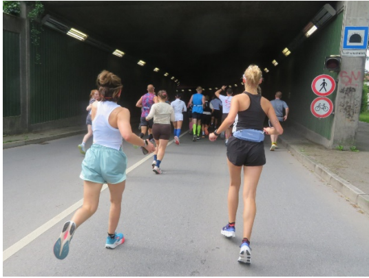
Ab in den Tunnel