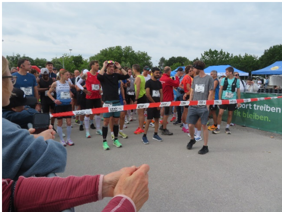
Die HM Elite vorm Start um 9 Uhr

Für Sonntag, 14. Juni , waren 3.869 Teilnehmende vorangemeldet und meldeten noch 110 vor Ort nach. Ins Ziel kamen bei nur ganz wenigen DNFs dann 3.518 Teilnehmende. Allein bei „meinem“ BMW Halbmarathon gab es 860 Vor- und 40 Nachmelder und finishten 736 Läufer*innen. Und wir durften um 9 Uhr als erste Distanz ins Rennen starten. Morgens war es mit rund 11-12 Grad noch recht frisch und windig und entschied ich mich kurzfristig vorm Start, doch noch ein Langarm-Shirt unter das T-Shirt anzuziehen. Denn die Temperaturen sollten laut Vorhersage bis mittags kaum über 15 Grad steigen bei heiter bis wolkegem Himmel. Das sollte ich nicht bereuen. Dank meiner eigenen Trinkfläschchen brauchte ich in der Masse der Aktiven nicht die 4 Wasser- und Cola-Stationen pro Runde anzulaufen.