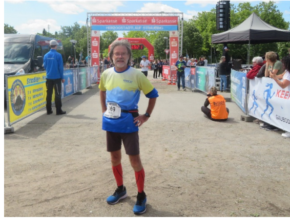
Der laufende Reporter hat fertig im Ziel !

Um 10:30 Uhr erfolgte der Start des 10 km Powerlaufes und des 40 km Teamlafes. Hier kamen 1.014 Aktive ins Ziel sowie 154 Mitglieder der Viererteams, deren Zehner-Zeiten addiert wurden. Um 11 Uhr ging es für 1.036 Einzelstarter und 173 Mitglieder der Viererteams auf die 5 km Fitness-Strecke. Und zuletzt waren um 11:15 Uhr über die 5 km die 405 (Nordic) Walker dran.