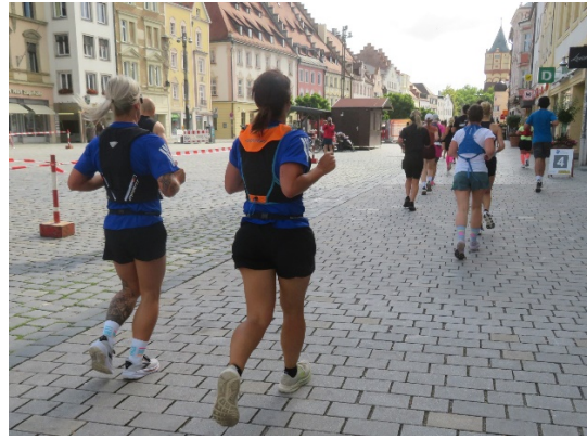
und über den Theresienplatz (km 4)

Nach genau 10 km erreichten wir wieder das Start-Ziel-Areal. Ich kam mit 59 Minuten vorbei und hörte den Moderator rufen, dass die Spitzengruppe bereits bei Kilometer 17 wäre. Nun folgte unsere zweite Runde, die nach etwa 1.500 m mit einer flachen Wendepunktstrecke am Moosgraben-Bach entlang auf genau 11,095 km ausgedehnt wurde.