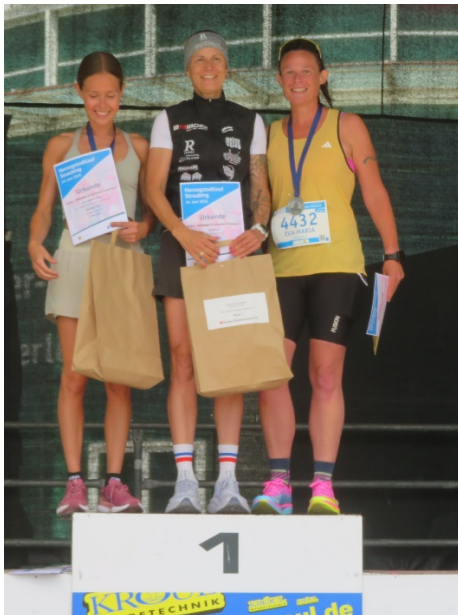
Die Siegerinnen über die 10 km

Um 10:30 Uhr erfolgte der Start des 10 km Powerlaufes und des 40 km Teamlafes. Hier kamen 1.014 Aktive ins Ziel sowie 154 Mitglieder der Viererteams, deren Zehner-Zeiten addiert wurden. Um 11 Uhr ging es für 1.036 Einzelstarter und 173 Mitglieder der Viererteams auf die 5 km Fitness-Strecke. Und zuletzt waren um 11:15 Uhr über die 5 km die 405 (Nordic) Walker dran.