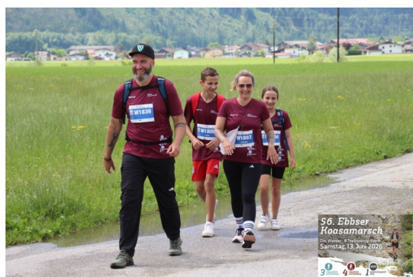
Läufer und fitte Wanderer kurz vor dem Musikantensteig – Der Wandertag mit der ganzen Familie