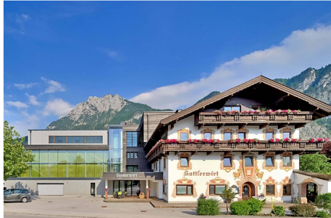
Der Sattlerwirt in Ebbs -